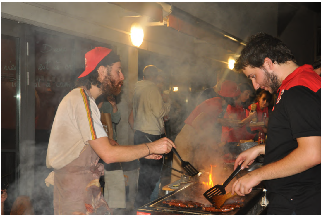
Photo des chefs Barbecue

Concert et Barbecue de rentrée avec le BDE : Sans doute le plus gros évènement de l'intégration. Le BDE s'occupait des boissons, la Zicbis de la musique et l'AS du barbecue. Nous avons deux barbecues fonctionnels. Nous avons proposé des hots-dogs (saucisse, merguez et saucisse végétarienne, accompagnées de légumes cuits au barbecue), les deux premiers étaient gratuits pour les adhérent-es.