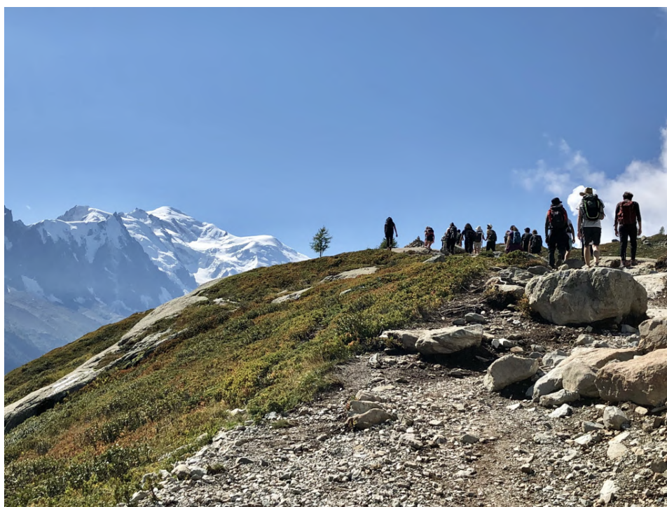
Photo de la randonnée à Chamonix