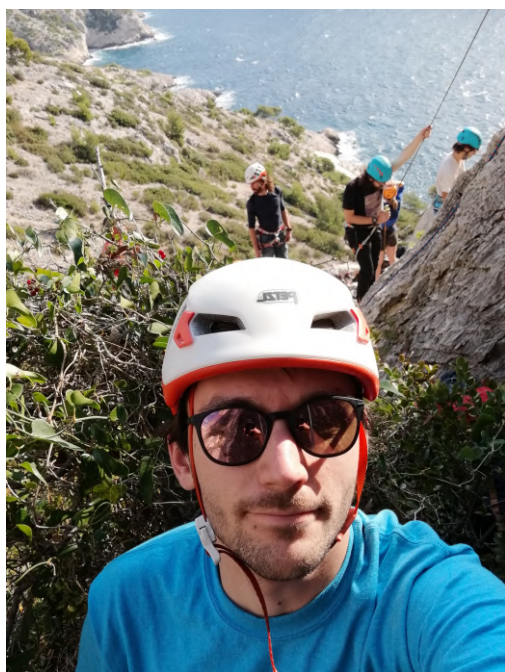
(a) Photo du groupe escalade