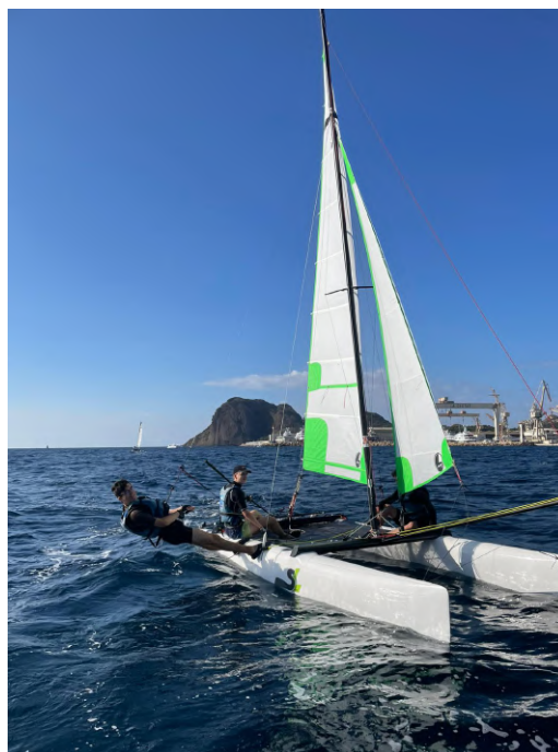
(b) Photo du groupe voile