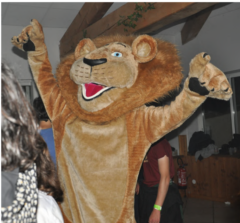
Photo de la mascotte au WEI

mate, slackline, cecifoot, ...). Le rôle de l'AS a donc été de mettre en place ces activités le jour-même, de les surveiller et de les encadrer puis de les ranger. Il est nécessaire qu'au moins une personne de l'AS participe au comité WEI, usuellement le respo WEI, pour suivre l'organisation en amont du week-end et y représente l'AS. Notre année, la présidente et le vice-président ont rejoint le comité WEI à cette fin.