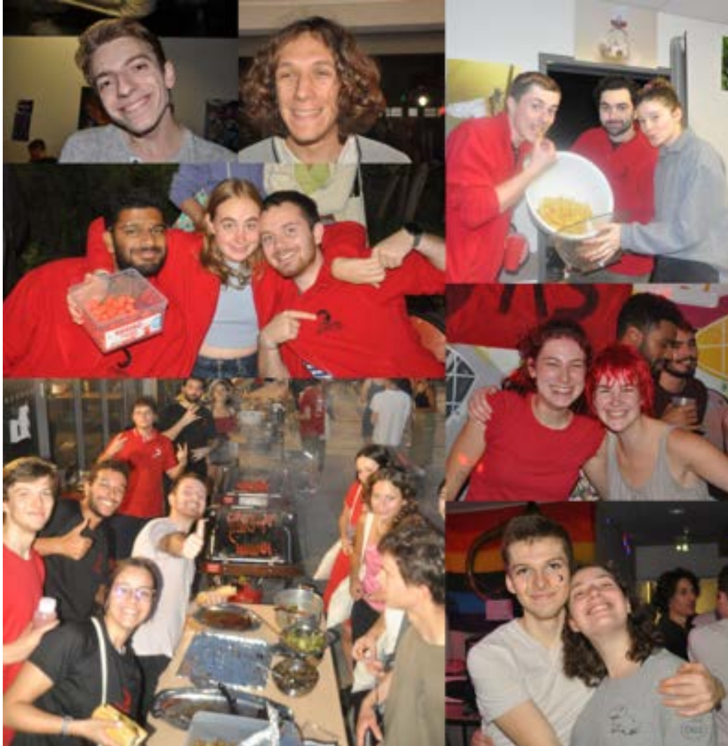
FIGURE 10 – Photos d'une partie de l'équipe, merci à vous et à tous.les les autres pour cette année incroyable !

événements tels que les barbecues admissibles et vin chaud. L'ensemble du bureau est très heureux d'avoir pu contribuer au maintien du dynamisme sportif à l'ENS de Lyon et pour l'expérience qu'ils ont pu partager ensemble durant tout ce mandat. Nous souhaitons au prochain bureau un excellent mandat et espérons qu'ils prendront autant de plaisir que nous à faire vivre le sport à l'ENS !