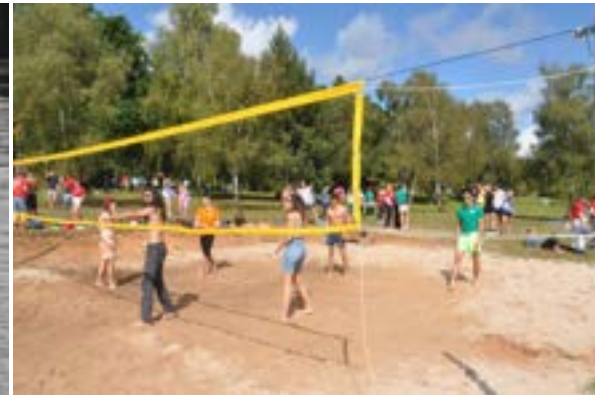
FIGURE 5 – Activités proposées par l'AS au WEI