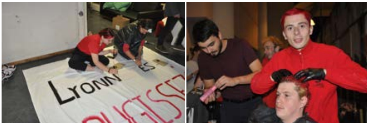
FIGURE 6 – Confection de drapeaux et atelier de teinture pendant la festive de chauffe des InterENS

Une festive de chauffe des InterENS a été organisée par l'AS et le comité InterENS la semaine précédant les InterENS. Cette festive fut l'occasion de reprendre les anciennes traditions des InterENS, à savoir la confection de drapeaux et la coloration des cheveux aux couleurs de l'école. Cette festive a connu beaucoup de succès et de nombreux·ses étudiant·e·s se sont teint les cheveux en rouge.