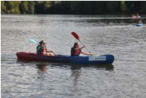
FIGURE 4 – kayak du WEI

Comme chaque année, l'AS participe à l'organisation des activités du samedi après-midi au WEI. Cette année, des jeux sportifs ( Ultimate , Beach-volley , Balle aux prisonniers ) ont été organisés, mis en place, animés et rangés par le bureau de l'AS. Le camping nous a également mis à disposition des pédalos, des kayaks et une structure gonflable aquatique dont l'utilisation et la surveillance étaient gérées par le bureau de l'AS avec l'aide du bureau du BDE. Nous nous sommes également occupés du repas du vendredi soir en organisant un barbecue. Nous avons aussi proposé d'animer deux bus : un bus AS et un bus Pompom . Il est nécessaire qu'au moins une personne du bureau de l'AS avec le rôle de responsable WEI participe au comité WEI et suive l'organisation du week-end suffisamment en amont pour choisir les activités avec le Tour Opérateur. Au moment du week-end, l'AS s'impliquant dans l'organisation, il est important d'avoir une dizaine de personnes du bureau présentes au WEI pour encadrer ces activités. La plupart des membres de l'AS présent·e·s appartenant également au BDE, la charge de travail tout au long du week-end est importante. Il serait donc intelligent d'avoir des membres du bureau de l'AS uniquement présent·e·s pour assurer les activités du samedi après-midi.