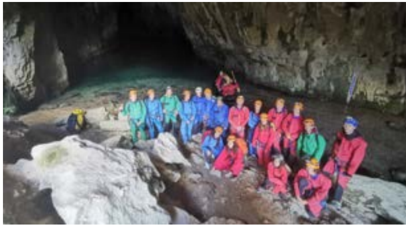
FIGURE 7 – Photo des participant-e-s à la sortie spéléologie dans la grotte de Gournier

le dimanche après-midi permettant de faire un tournoi intersportif. Cette année, le WECO a eu lieu au centre d'Hauteville le week-end du 7-8 octobre et les participant-e-s étaient logé-e-s dans le centre sportif. La localisation et les infrastructures sont exceptionnelles et permettent aux sportifs de profiter pleinement de leur week-end. Comme chaque année, l'AS a préparé l'apéro du samedi soir qui a eu lieu après le repas. De nombreux cookies vegans, gâteaux, pizzas et fameuses tartes soleil ont été cuisinés par l'AS et des bières et boissons non alcoolisées étaient proposés. Ce week-end s'est bien déroulé et a beaucoup plu. Néanmoins, seules les équipes de basket, ultimate, volley et football étaient présentes et l'équipe de foot était fortement réduite avec uniquement 4 personnes présentes sur les 7 inscrites. Depuis quelques années, on peut remarquer un épuisement de certains sports collectifs comme le rugby, le handball et le foot qui sont de moins en moins représentés au WECO. La sortie fut tout de même complétée grâce aux volleyeurs et aux volleyeuses. Malgré tout, à cause de blessure ou d'absence, 6 personnes sur les 62 inscrites n'ont pas pu venir à la sortie. Faire une meilleure communication dès la rentrée sur la sortie pour les autres sports et sur la liste d'attente permettrait de remplir plus facilement la sortie et de la rendre plus populaire auprès des adhérent-e-s.