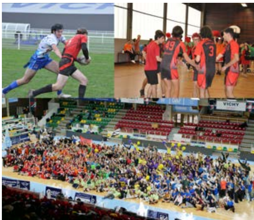
FIGURE 8 – Photos de nos sportif.ves lors des InterENS!