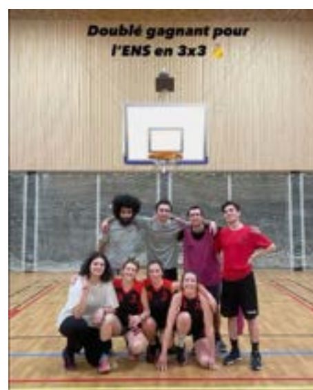
FIGURE 9 – Stories Instagram du compte de l'AS relatant les exploits de nos équipes