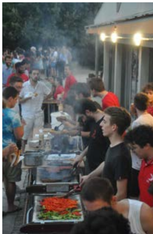
FIGURE 3 – Le bureau de l'AS servant le BBQ