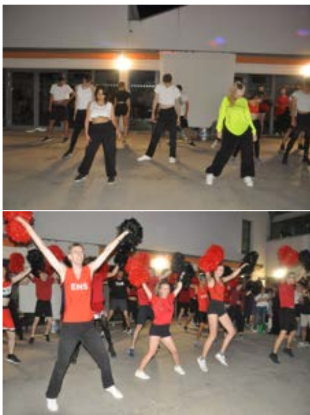
FIGURE 2 – Show Pompom et Bouli des AS de la pétanque