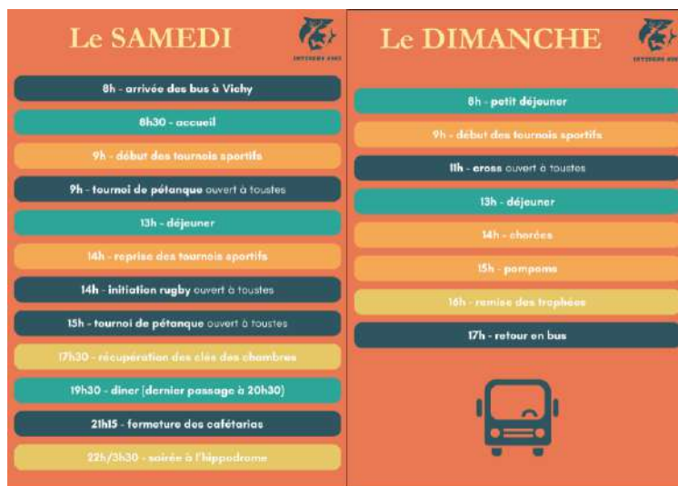
Planning du week-end des InterENS sportives 2023, extrait du Guides des InterENS sportives 2023