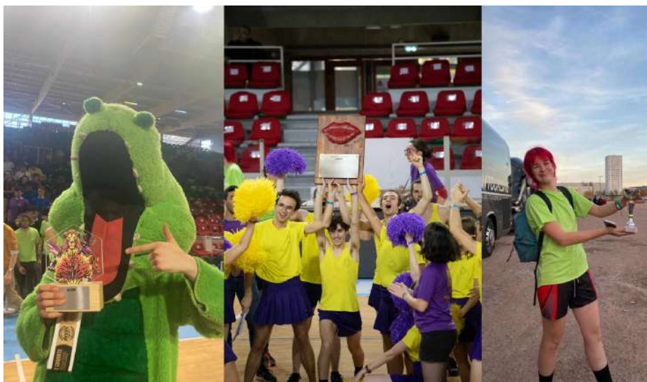
Photo des trophées de l'édition 2023 des InterENS sportives, de gauche à droite : SLURP, SMAC et ambiance

Le trophée du fair-play a été attribué après concertation au sein du comité.