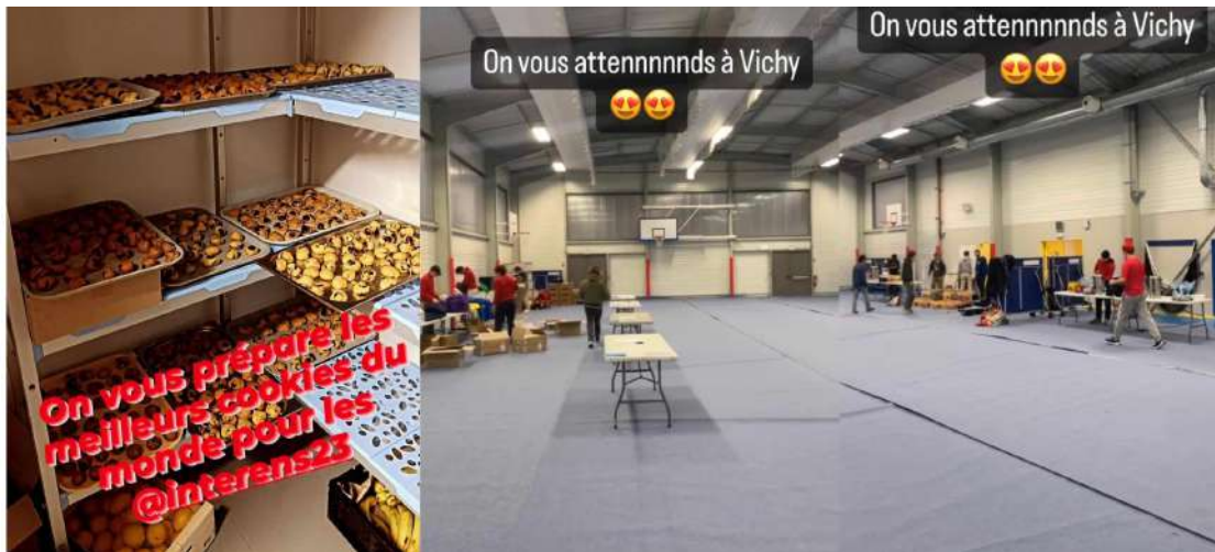
Accueil des participant.es à l'EMB le samedi matin et cookies

thé, jus, eau et des collations préparés à l'avance par Lyon (cookies, cake au citron et banana bread avec des options végans, voir photo gauche 8). La plupart des participant.es ont pris leur collation à l'extérieur du gymnase pour libérer de la place. Le gymnase est un peu petit pour accueillir confortablement plus de 600 personnes en cas de pluie. Le créneau affecté à l'arrivée des participantes et la collation était serré pour celles qui devaient se rendre au gymnase Jules Ferry (installation sportive la plus éloignée). Bien que tout le monde ait pu récupérer ses goodies et son bracelet à temps, il ne leur restait que peu de temps pour faire une pause après le long trajet en bus avant de repartir en direction de leur tournoi.