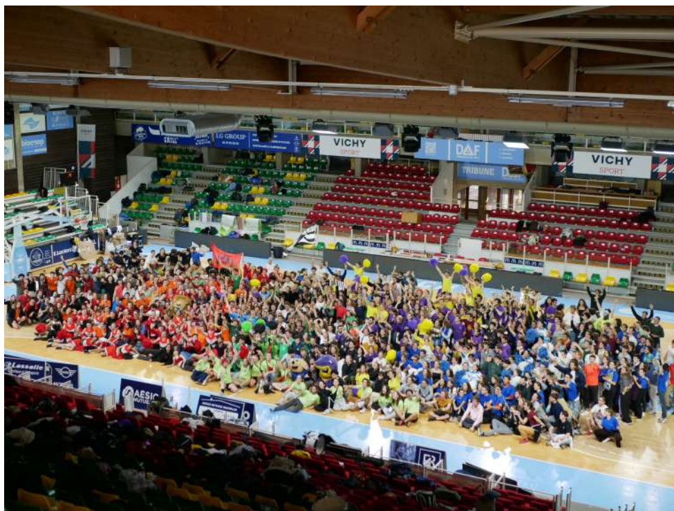
Photo de la fin des InterENS sportives 2023 avec tous.les participant.es lors de la remise des prix