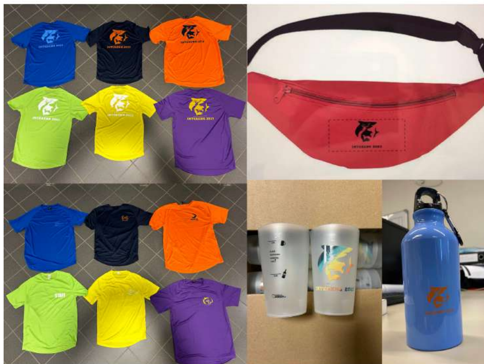
Photos des goodies des InterENS sportives 2023

Ce pôle s'est chargé du choix et de la commande de goodies pour cette édition 2023. Un T-Shirt, d'une couleur différente selon son école, a été offert à chaque participant.e. Un écopup a aussi été offert à chaque participant.e. Une gourde et une banane était proposée à l'achat lors de l'inscription (voir photos 2)