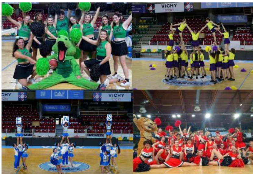
Encore des photos de nos sportif.ves

Malgré ces petites remarques, le format des tournois ont été appréciés, noté en moyenne 4/5 dans le questionnaire de satisfaction.