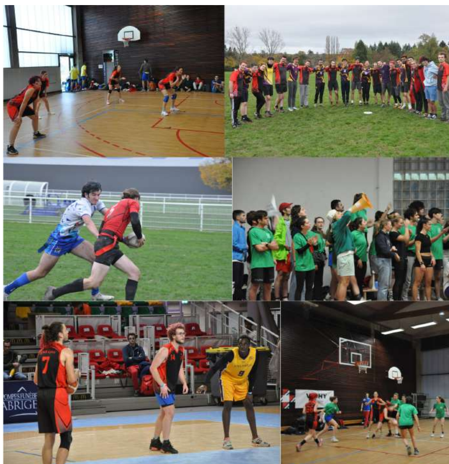
Quelques photos des sportif.ves des InterENS sportives 2023

La diversité de l'offre sportive a été très appréciée, elle a été notée 4,5/5 en moyenne dans le questionnaire de satisfaction. La seule remarque qui a pu ressortir est la frustration des joueur.euses de rugby à jouer du flag rugby et non du rugby plaqué. En effet, par manque de pratiquant.es dans toutes les écoles sauf Saclay, nous avons décidé de mettre en place un tournoi mixte de flag rugby, cela nous semblait le juste milieu entre proposer une épreuve de